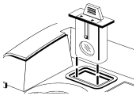
图 3 将过滤装置插入小室