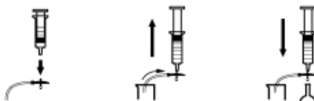
图 5 过滤装置

请按 图5 所示的样品过滤和脱气装置(产品编目: 43975-10)对样品进行过滤。如果过滤器堵塞太快, 请使用图 6 所示带有膜过滤器(产品编目: 13530-01)的标准 47mm 过滤装置, 或使用玻璃纤维过滤器(产品编目: 2530-00)过滤高固含物的样品。